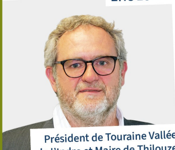
Président de Touraine Vallée de l'Indre et Maire de Thilouze