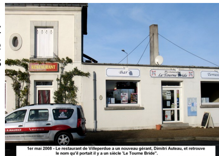
1er mai 2008 - Le restaurant de Villeperdue a un nouveau gérant, Dimitri Auteau, et retrouve le nom qu'il portait il y a un siècle, « Le Tourne Bride ».