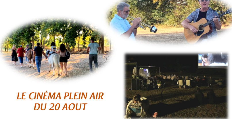
LE CINÉMA PLEIN AIR DU 20 AOUT