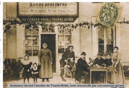
Ambiance devant l'ancien du Tourne-Bride, nom ressuscité par son nouveau gérant. Villeperdue - 1903-1907